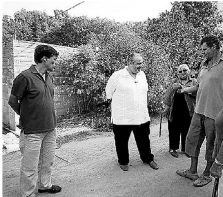
El cocinero Santi Santamaría, en el centro, junto a Joan Salicru.

Siguiendo este calendario, el 27 de abril plantó cebollas, planta de raíz y el 30, lechuga, de hoja. “En luna decreciente porque la savia va a la raíz; trabajo siguiendo la naturaleza”, resume.